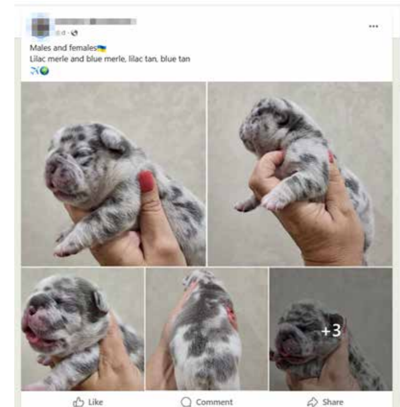
Foto 1: Te jonge puppy's te koop aangeboden. Stamboompapieren werden gebruikt als bewijs van legitimiteit. (Screenshot date: 25.09.2023).

Twee Oost-Europese verkopers adverteerden met veel te jonge puppy's in Duitse Facebookgroepen met logo's en papieren die suggereerden dat ze gerenommeerde en gecertificeerde fokkers waren. Desondanks werden de puppy's te koop aangeboden voor import in Duitsland onder de wettelijke leeftijd.