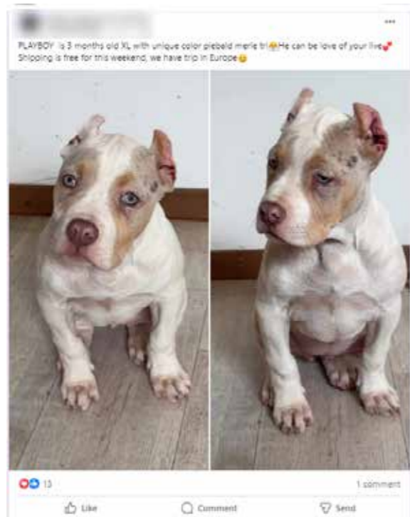
Foto 4: Amerikaanse Bulldog puppy's met afgeknipte oren in een Nederlandse Facebook-groep door een verkoper uit Slowakije. Oor afknippen (croppen) is verboden in Nederland. [Screenshot date: 18.04.2024].

Amerikaanse Bulldog puppy's met afgeknipte oren werden geadverteerd in een Nederlandse Facebook-groep door een verkoper uit Slowakije. Oor afknippen (croppen) is verboden in Nederland. De groep was besloten maar met meer dan 6.000 groepsleden konden de verkopers makkelijk potentiële kopers bereiken. De puppy's waren nog niet in Nederland maar werden pas na de aankoop naar Nederland vervoerd. Het is aannemelijk dat door dergelijke besloten groepen de illegale handel op Meta-platforms kan gedijen.