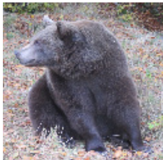
Bärin Miri hält bereits Ausschau nach dem ankommenden Bus und seinen Fahrgästen

Besonders günstig: Wer umweltfreundlich mit öffentlichen Verkehrsmitteln anreist, hat es gut: Bei Vorweis des Busfahr Scheins nach Arbesbach an der Bärenwald-Kasse erhalten Sie ein um 50% ermäßigtes Eintrittsticket!