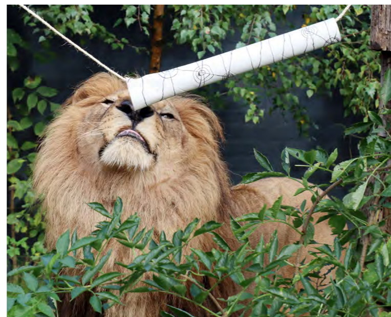
👉 Futter und Leckerli für die Großkatzen werden immer wieder neu versteckt. Das sorgt für Bewegung und fördert Intelligenz und Geschick der Tiere.

Neben psychischen Problemen kämpfen fast alle der geretteten Großkatzen lebenslang mit gesundheitlichen Schäden. Ihre Zähne sind von Karies befallen oder vom Kauen an den Gitterstäben abgebrochen. Sie haben Hautkrankheiten, geschädigte Gelenke, Nieren- und andere Organschäden. In allen Schutzzentrum von VIER PFOTEN erhalten die Großkatzen direkt nach ihrer Ankunft exzellente medizinische Versorgung. Auf Wildtiere spezialisierte Veterinärmediziner, Zahnärzte und Anästhesieexperten können die Tiere in FELIDA in Narkose legen und operieren. Da in FELIDA ausdrücklich nicht gezüchtet wird, werden alle männlichen Großkatzen kurz nach ihrer Ankunft kastriert.