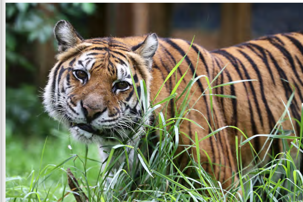
👉 Viele Tiere sind vom Schicksal gezeichnet: Löwen mit zerrupfter Mähne, humpelnde Tiger, verängstigt und geschwächt. In FELIDA erhält jedes Tier eine ganz individuelle Therapie.