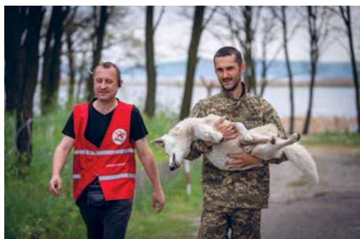
"Onze teams in Oekraïne blijven zich onvermoeibaar inzetten."

Al ruim tien jaar zijn wij actief voor zwerfdieren in Oekraïne, maar vandaag de dag is de hulp meer nodig dan ooit tevoren. Onze teams blijven zich dan ook onvermoeibaar inzetten, want ieder dierenleven is het redden waard.