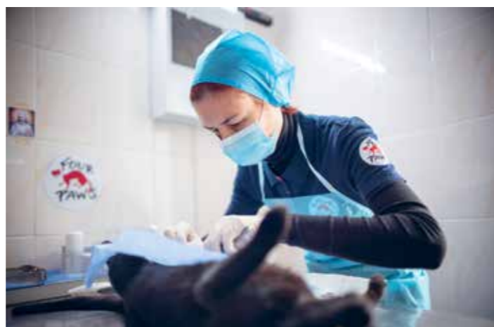
"Met ons Project Kishka krijgen zwerfkatten de hulp die zij nodig hebben."